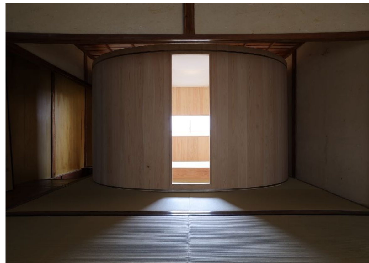
中川周士「木の部屋」 2022