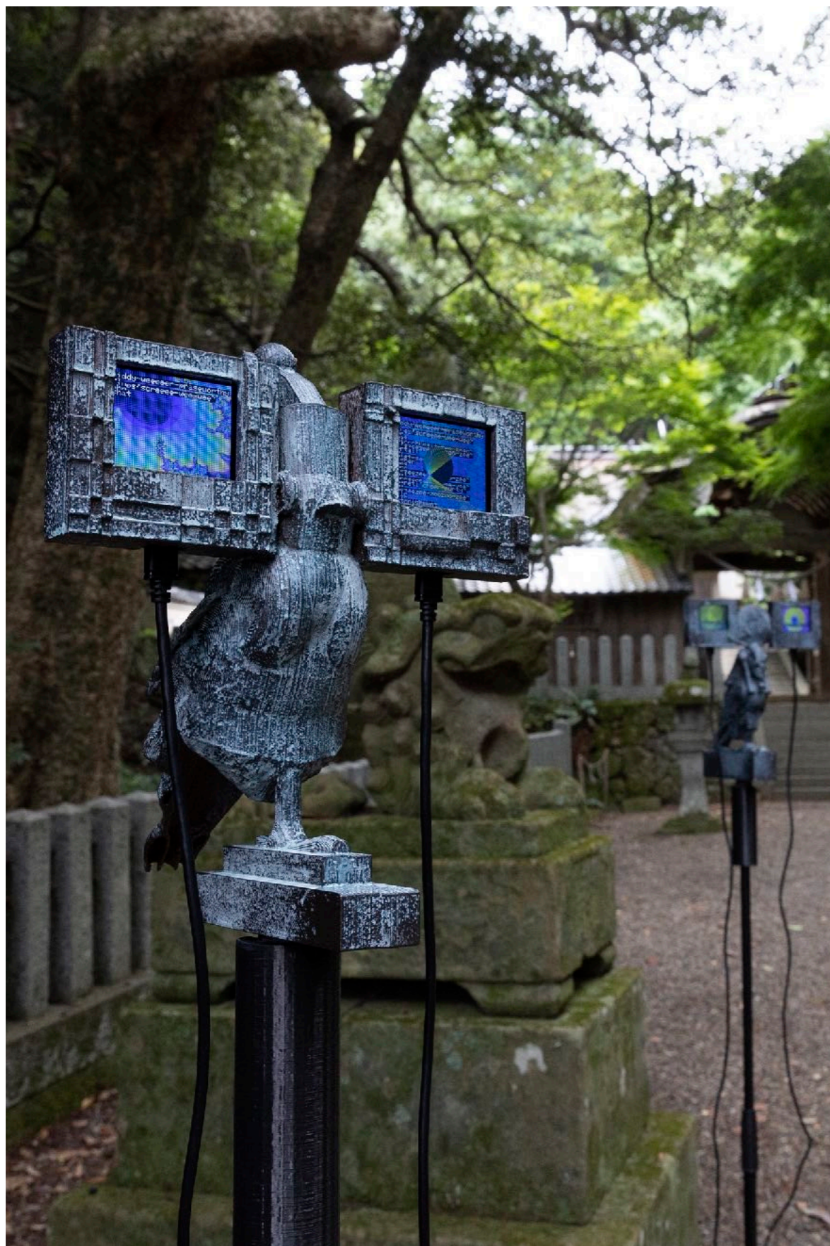
Samson Young "The Messengers", 2022