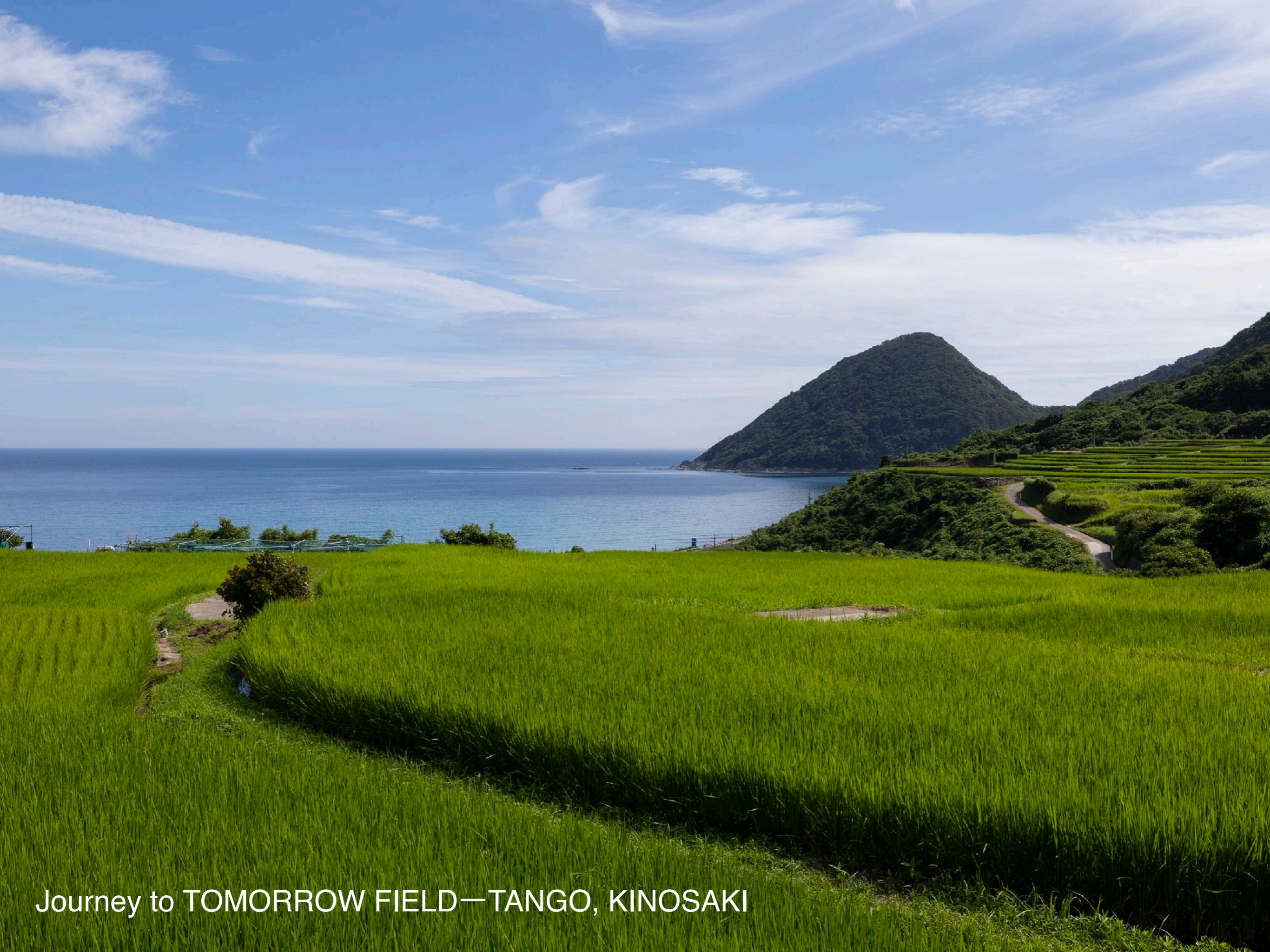
Journey to TOMORROW FIELD—TANGO, KINOSAKI