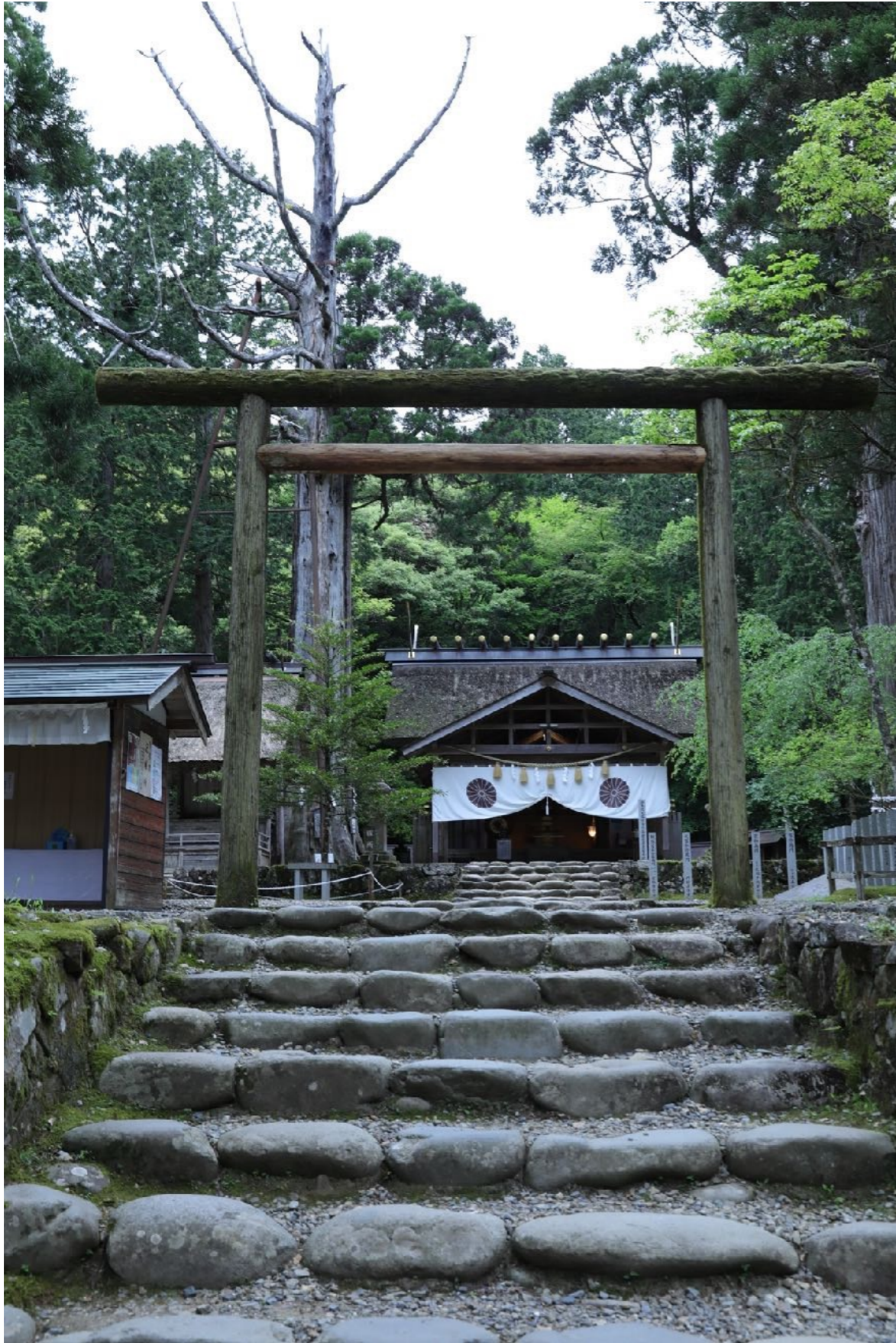
元伊勢内宮皇大神社